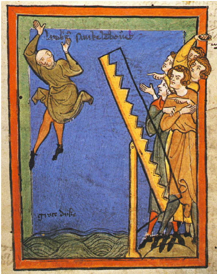
1300-luvun lopun maalaus "leipurinkasteesta".