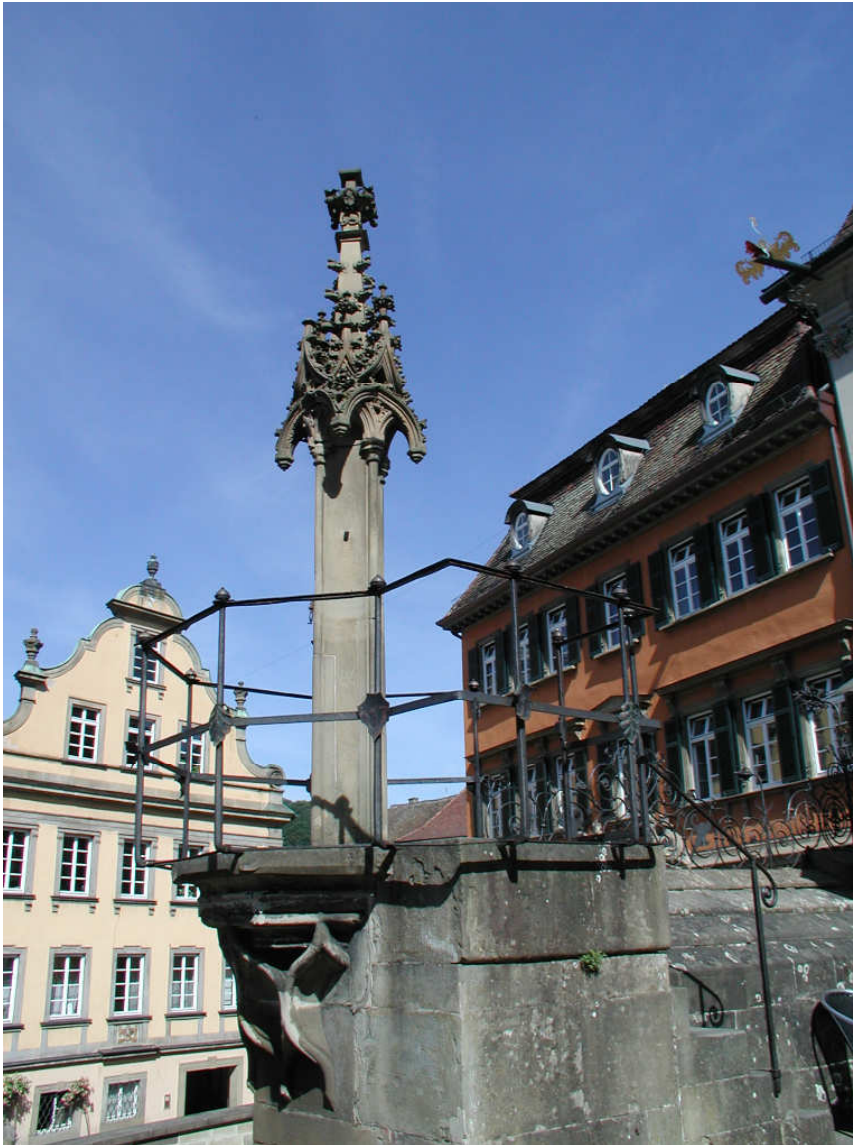
Häpeäpaalu (Schwäbisch Hall).

Häpeäpaalussa seistiin joitakin tunteja kerrallaan markkina- tai pyhäpäivinä, jolloin mahdollisimman suuri ihmisjoukko oli näkemässä. Häpeäpaalurangaistuksen pääasiallisena toimeenpanijana oli aina pyöveli, vaikka hänellä saattoi olla mukanaan myös apulaisia. Tuomitun kaulaan voitiin ripustaa kyltti, jossa kerrottiin tehdystä rikoksesta. Varkaudesta tuomitun ympärille voitiin laittaa varastettuja esineitä, kuten Münchenissä vuonna 1600, kun kanavarakaan kaulaan ripustettiin hänen varastamansa linnut.