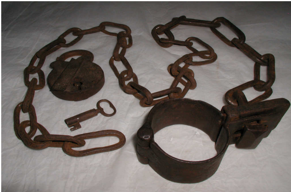
Kahle, avain ja lukko (Nationalmuseum Bayern).

Tuomio julkiseen pakkotyöhön, ad opus publicum , tuli Saksan eteläisissä territoriois-sa käyttöön vasta 1500-luvun lopulla ja pohjoisilla alueilla vielä myöhemmin. Baijeri oli ensimmäinen territorio, jossa sitä harjoitettiin laajemmin ja herttuan määräyksestä. Pakkotyö säästi vankeuskustannuksissa ja valtio hyötyi ilmaisesta työvoimasta. Sa-malla se oli julkista häpäisyä, jolla oli pelotettava. Lievimmässä muodossaan pak-kotyössä oli kyse symbolisesta tai kevyestä työstä, jolloin ensisijainen tarkoitus oli julkinen häpäiseminen. Ankarimmillaan tuomitut pantiin raskaaseen työhön mm. lin-noituksilla. Tällöin tuomiossa saatettiin mainita tietty lukumäärä kiviä, jotka heidän oli kannettava. Tällainen rangaistus vastasi ankaruudessaan usein ruumiillista rangais-tusta.