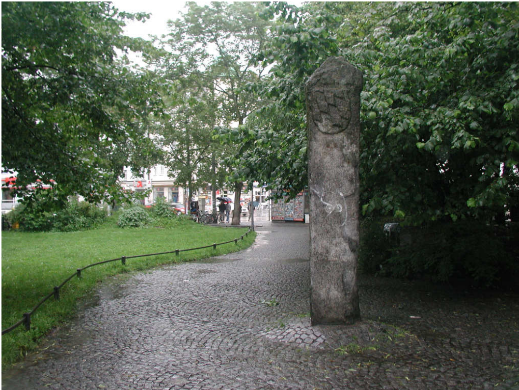
Rajapyykki merkitsee kaupungin oikeustoimialueen päättymistä, jonka merkinä Bajerin herttuakunnan viinoruutuinen vaakuna.

Yksi kaikkien aikojen yleisimmistä rangaistuksista on karkotus eri muodoissaan. Näin yhteisö pääsi eroon ei-toivotuista henkilöistä kustannuksitta. Karkotukset ovat myös oman tutkimukseni suurin rangaistusryhmä, mutta niitä koskevat pöytäkirjamerkinnot ovat erityisen horjuvia. Usein ei kirjoitettu lainkaan muistiin, oliko kyseessä pelkkä karkotus vai edelsikö sitä jokin häpeällinen toimenpide. Toisaalta raipparangaistuksen ja häpeäpaalun yhteydessä ei aina mainita karkotusta, vaikkakin se ainakin jälkimmäisessä tapauksessa oli säännönmukaista. Usein ei myöskään mainita, oliko kyseessä karkotus tietyksi ajaksi vai koko elämäksi, karkotus kaupungin oikeustoimialueelta vai koko herttuakunnasta.