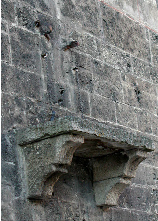
Häpeäpaalu (Wasserburg).

Kun raipparangaistus tapahtui häpeäpaalussa ja sen suoritti pyöveli, liittyi siihen karkotus ja silloin se oli osa kunniarangaistusta. Ankarimmillaan oli raippa tai ruoskinta todella kova rangaistus, josta saattoi seurata pysyviä vammoja tai jopa kuolemaan johtava tulehdus. Raipparangaistus saattoi myös toimia häpeäpaalun häpeällisenä lisänä lievennetyssä muodossa, jolloin vitsakimppua vain näytettiin tai se ripustettiin tuomitun pään päälle.