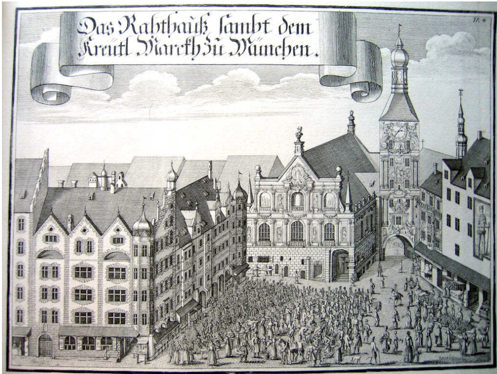
Münchenin raatihuone torneineen.