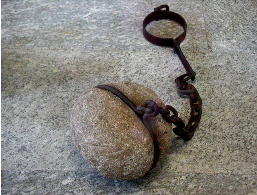
Synninkivi (Kriminalmuseum Rothenburg ob der Tauber)