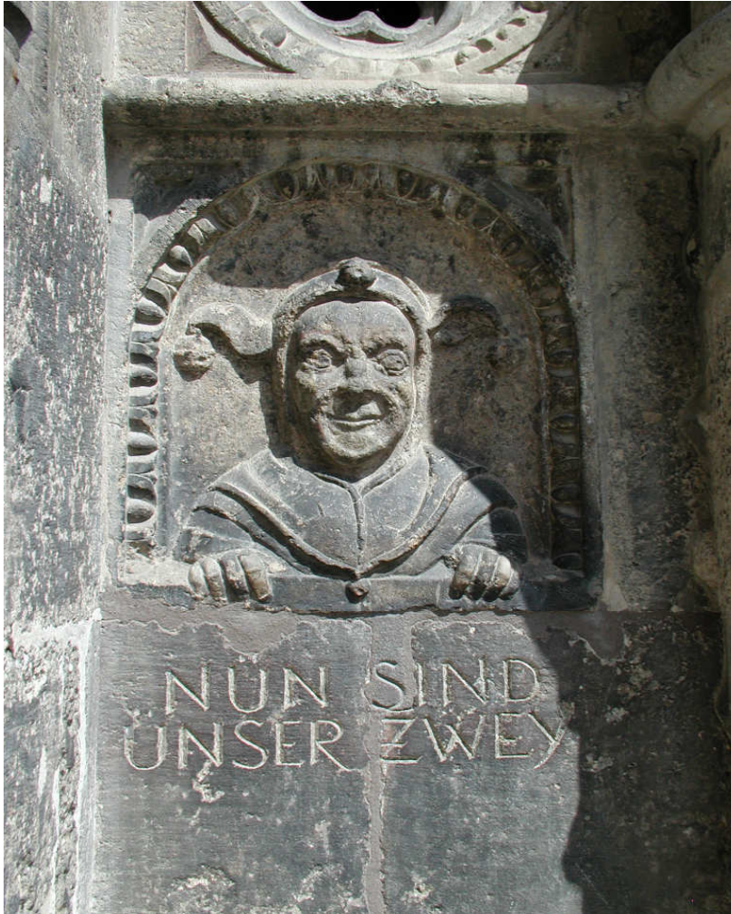
Nördlingenin myöhäisgoottilainen narrinkoppi. Kaiverrus kertoo, että ”nyt meitä on kaksi”.

Seisottaminen kirkon edessä kaularautaan kiinnitettynä oli aiemmin käytetyn kirkollisen rangaistuksen maallinen versio. Se ei infamoinut, mutta vahingoitti sosiaalista kunniaa merkittävästi. Tämän vuoksi koettivat tuomitut yleensä vaihtaa saamansa rangaistuksen sakkoon, mikäli mahdollista. Tämä vaihtoehtoisuus toimi myös päinvastaisesti, kuten erään aviorikkojan tapaus vuonna 1596 osoittaa. Mies tuomittiin 50 guldenin sakkoon, ”ellei hän sitten halunnut mieluummin seistä kirkon edessä”, kuten tuomion yhteydessä mainittiin. Sitä, joka ei halunnut tai voinut maksaa, rankaistiin julkisella häpäisyllä. Torilla seisottaminen oli samankaltainen, mutta korostetusti maallinen sanktio. Siihen tuomittiin mitä erilaisimmista rikoksista, kun taas kirkon edessä seisominen koski lähinnä sellaisia tekoja, jotka ennen olivat kuuluneet kirkkokurin alle, kuten aviorikos ja jumalanpilkkä.