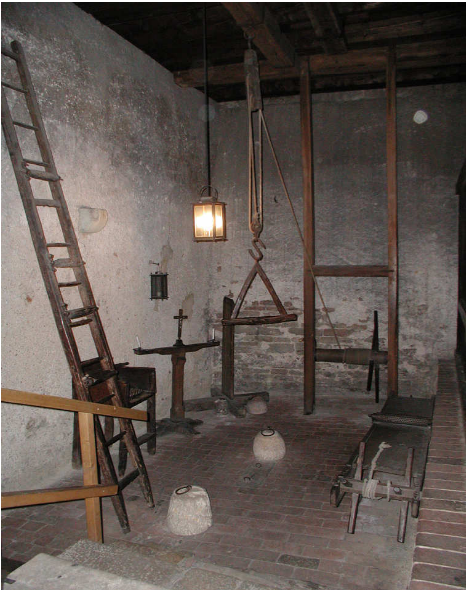
Regensburgin raatihuoneen ”kidutuskamio”. Lattialla kaksi painoina käytettyä kiveä.

Toisen maailmansodan tuhojen ja uudelleenrakentamisen takia ei Münchenin vankitiloja enää ole olemassa. Myöskään kirjallisuus ei tarjoa kovin tarkkoja yksityiskohtia. Eräissä muissa eteläsaksalaisissa kaupungeissa on kuitenkin vielä jäljellä alkupe räisasussa olevia vankitiloja, jotka voivat tässä toimia esimerkkeinä. Ei ole mitään syytä olettaa, että ne olisivat kovasti poikenneet Münchenin olosuhteista.