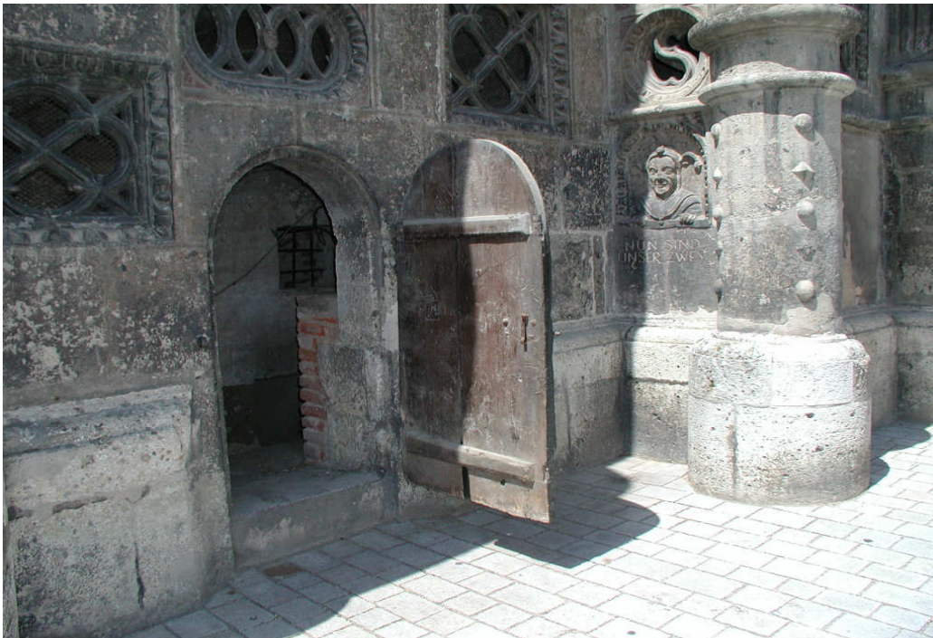
Ovi johtaa Nördlingenin raatihuoneen kellarivankilaan.

Inventaarioissa mainitaan myös suuret määrät erilaisia kahleita, jotka voitiin lukita käden, jalan tai kaulan ympärille. Näitä instrumentteja käytettiin myös vankien kuljettamisessa rangaistuspaikalle ja pakkotoissa. Kidutuskammiossa säilytettiin mm. seuraavia esineitä: kirjoituspöytä, kuulusteluissa tarvittava köysi, viisi kivistä painoa, musta kirjoitustaulu sekä kaksi mustaa hametta ja paitaa, joihin naispuoliset kuulusteltavat puettiin. Esinelistaukset kertovat myös arkisemmasta elämästä vankilassa, sillä niissä mainitaan mm. kupariset pesusoikot, tinaiset juoma-astiat, tarjottimet, joilla kannettiin vangeille ruokaa, jopa pöytiä ja pöytäliinoja, penkkejä, soihtuja, kynttilöitä sekä villaiset peitot tai nukkuma-alustat vangeille. Inventaariot mainitsevat myös selkeissä ja vanginvartijan asunnossa säilytettävät krusifiksit sekä jesuiittojen vangeille lahjoittaman kirjan nimeltään ”sydämenlohduttaja”.